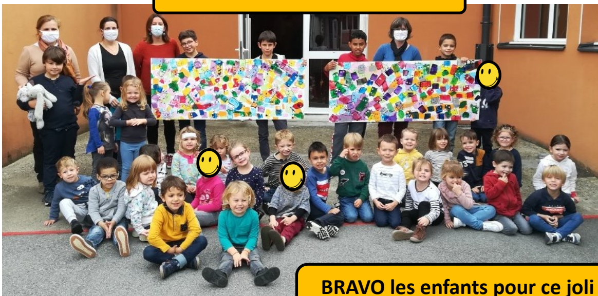
PHOTO DE GROUPE