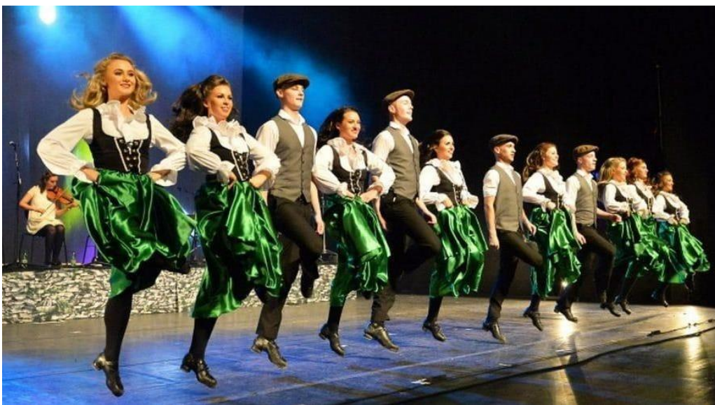
Les danses folkloriques irlandaises (claquettes)