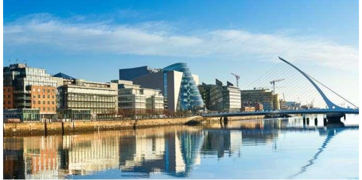
Pont Samuel Beckett en forme de harpe à Dublin