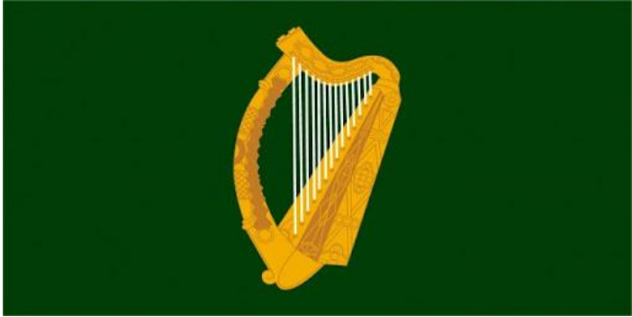
La harpe irlandaise

- Nous avons découvert quelques symboles de ce pays :