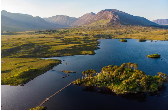
Lac Derryclare Connemara

- Nous avons vu des photos de paysages d'Irlande :