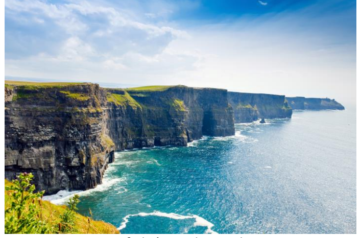
Les falaises de Moher

Les moutons qui aiment se promener dans ces beaux paysages.