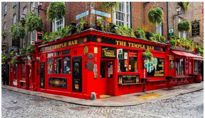
Temple Bar à Dublin