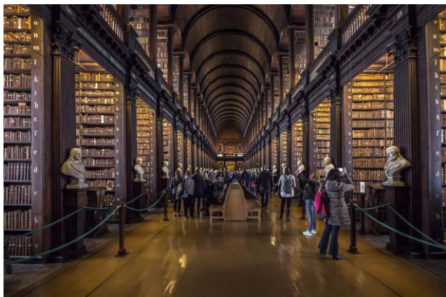
La bibliothèque de Trinity College à Dublin