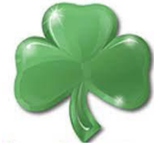
Le trèfle irlandais